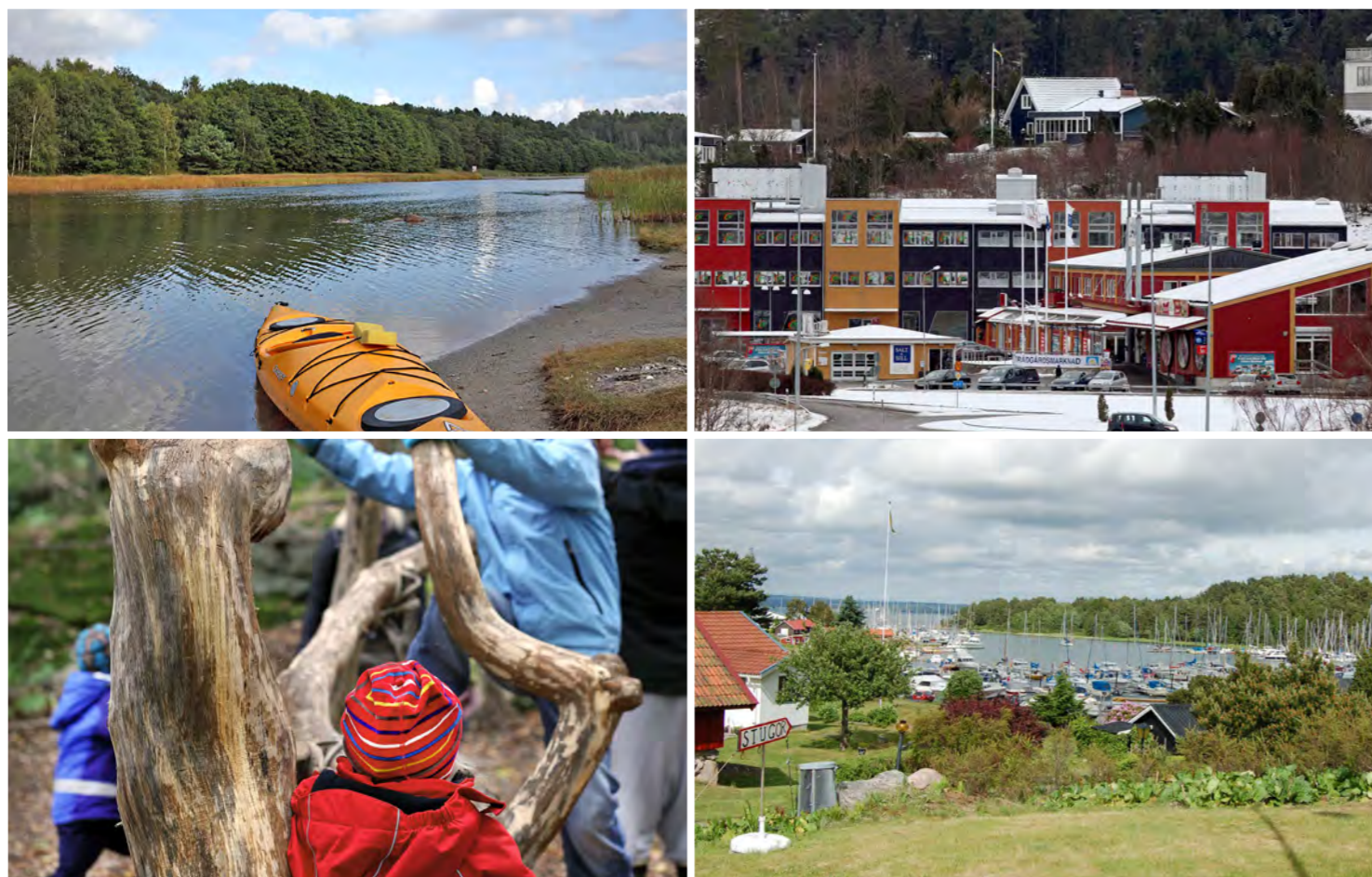
Bilder från Tjörn. Överst till vänster: De lugna vattnen kring Almön är perfekta för kajak och kanot. Överst till höger: Myggenäs centrum har de senaste åren kompletterats med ytterligare service och verksamheter i centrumhuset. Nederst till vänster: Vid Sundsby Säteri finns en populär naturlekplats som är en förebild för den som föreslås på Almön. Nederst till höger: Utsikt från väg 160 österut mot småbåtshamnen.

vattnet. I takt med att fler funktioner, som exempelvis bostäder, tillkommer på Almön, ökar behovet av att läka ihop tätorten till en enhet. Ett annat tydligt uttalat önskemål från de boende och verksamma i Myggenäs och Almöstrand var fler och bättre gemensamma platser. Lekplatser, parker, bättre gång- och cykelstråk var gemensamma funktioner som lyftes fram som särskilt viktiga. I den här förstudien har dessa tankar varit vägledande.